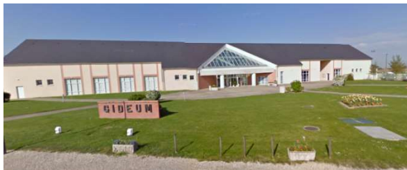
Complexe du Gidéum 44 Rue du Stade GIDY