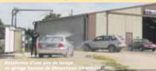
Installation d'une aire de lavage au garage Vannier de Ménéstreaux-en-Villette

Je suis très satisfait de l'accueil des Saint-Florentais. J'espère pouvoir ainsi contribuer au développement de la commune.